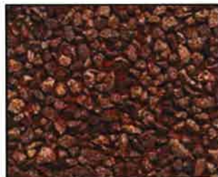
Roter Basalt * Korngröße: 5-8