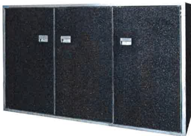
Doppelschrank Waschbetontüren Ausführung schwarzer Basalt