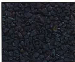
Schwarzer Basalt * Korngröße: 5-8