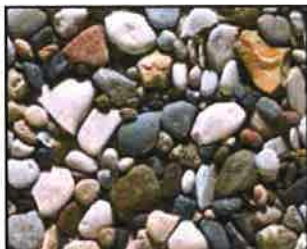
Leinekiesel - Standard Korngröße: 2-16

Druck- und fototechnisch bedingte Farbabweichungen sind möglich! Abbildungsmaßstab: 1:2