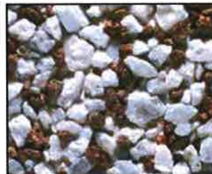
Nordischweiß mit Weißzement und rotem Basalt Korngröße: 5-8