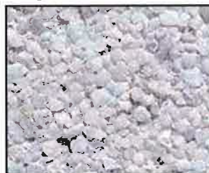
Nordischweiß m. Weißzement Korngröße: 5-8