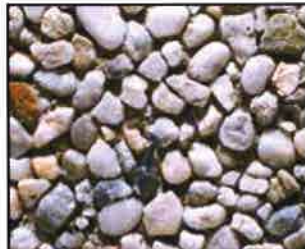
Quarzkiesel Korngröße: 8-12